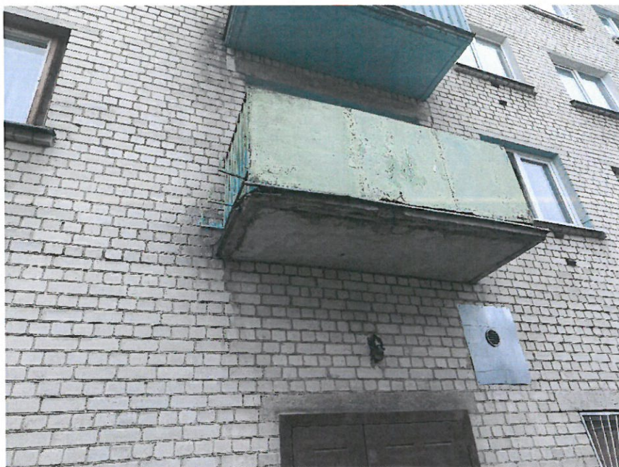
Nuotrauka nr.6 ( 34 bt.)