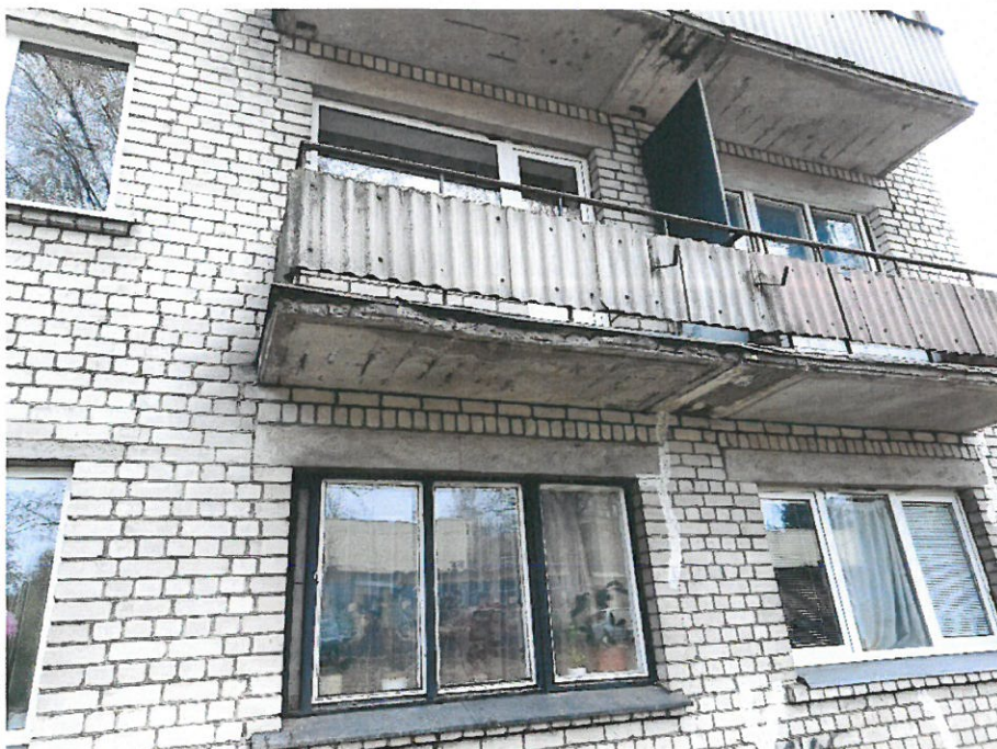
Nuotrauka Nr.15 ( 8,7 bt.)