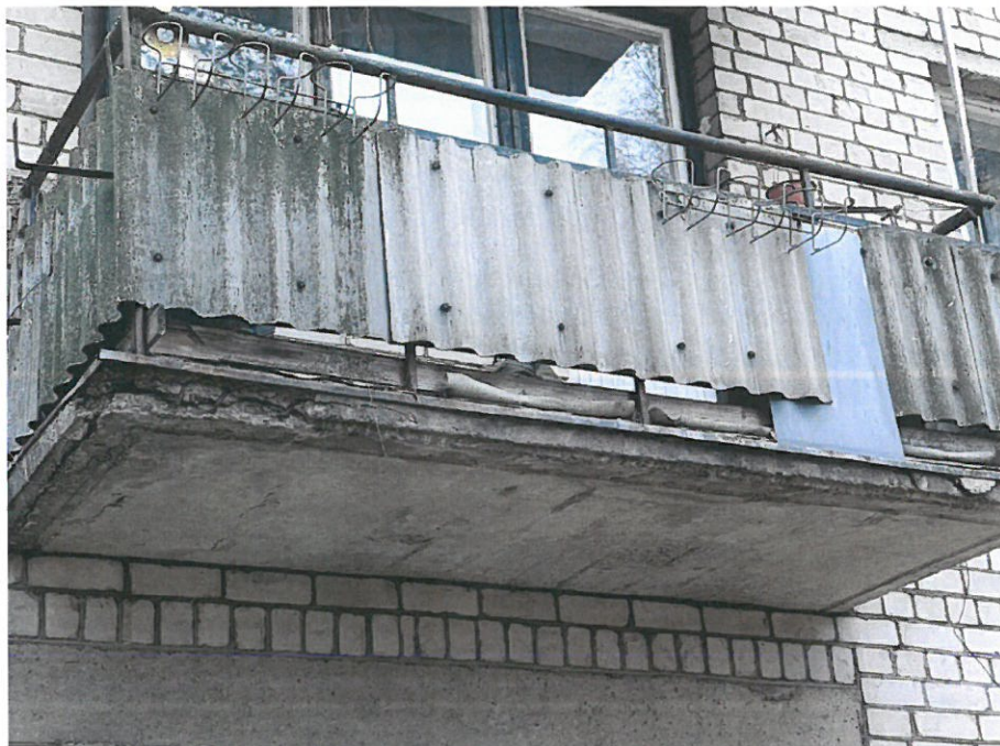
Nuotrauka Nr.11 ( 21 bt. )