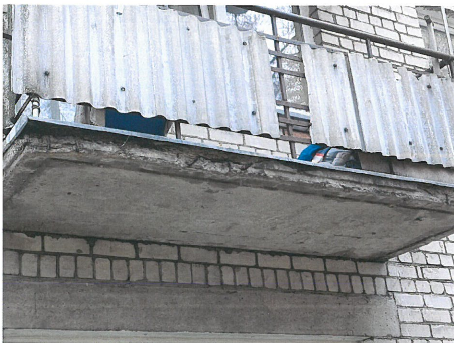
Nuotrauka Nr.9 ( 32 bt. )